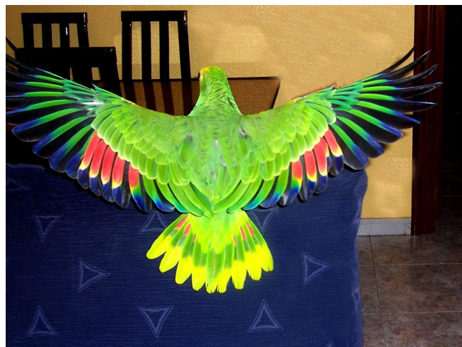
© Fina Alcaraz — Ala elíptica

En el caso que nos ocupa, las psitácidas, podemos hablar que presentan principalmente uno o dos de estos tipos (o la mezcla entre ambos) en función de los hábitats que explotan.